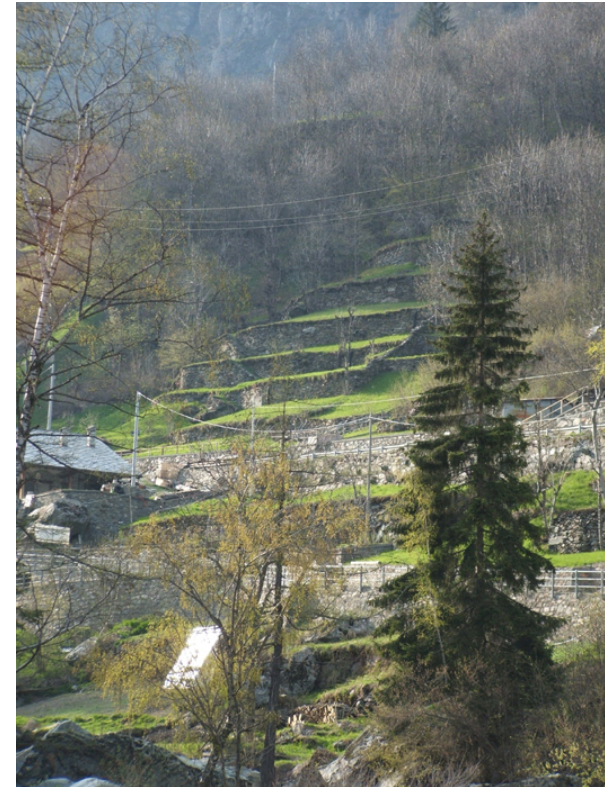
Terrain abrupte aménagé en terrasses