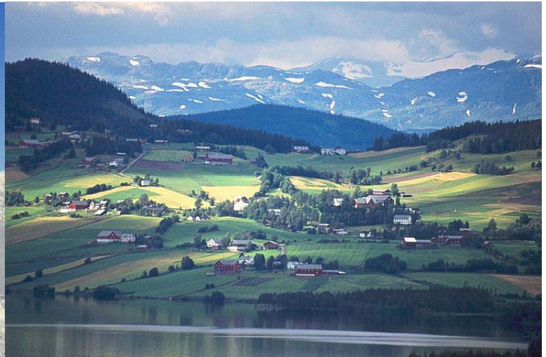
Paysage d'hiver et d'été dans la région de Valdres