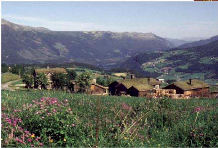
Ferme de Valbjør