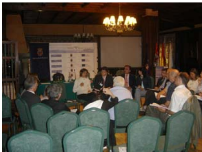
Réunion du Comité de Pilotage du projet "Euromoutains.net"